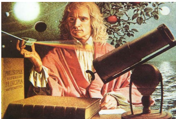
Сэр Исаак Ньютон (04.01.1643 — 31.03.1727)