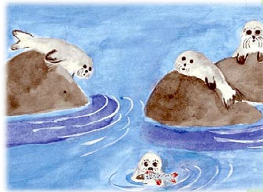
Детские иллюстрации по теме «Байкал»