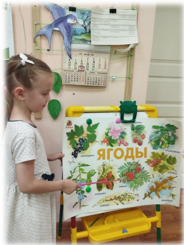
Анализ отличительных особенностей ягод