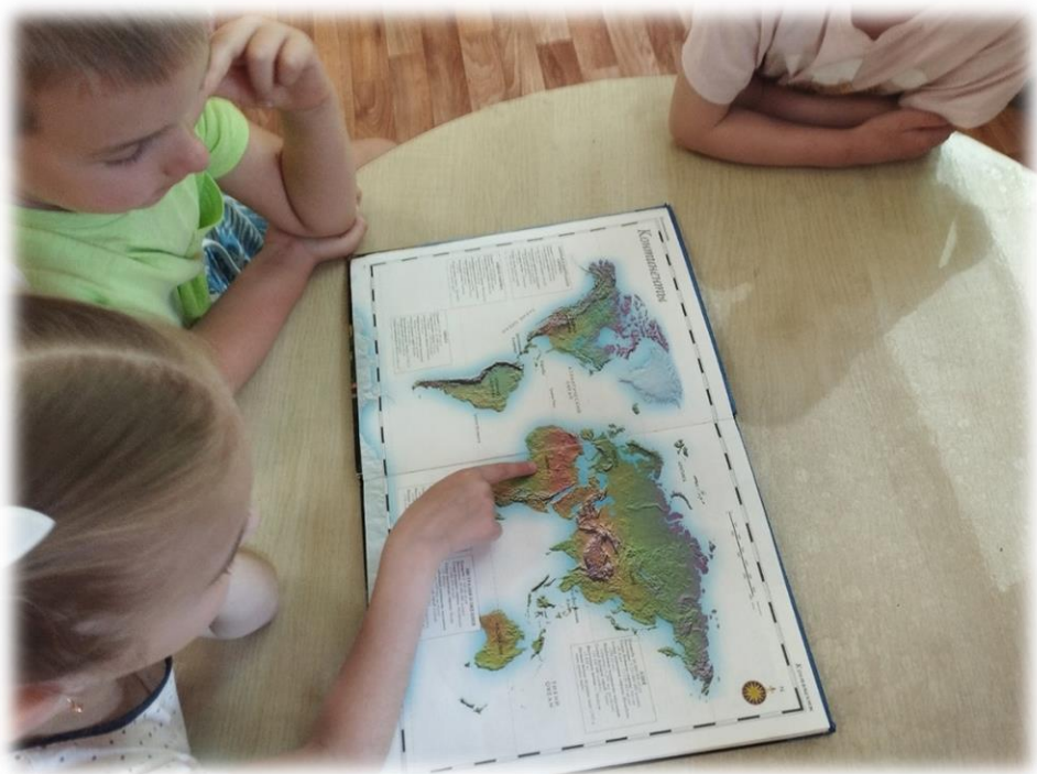
Работа с геологической картой