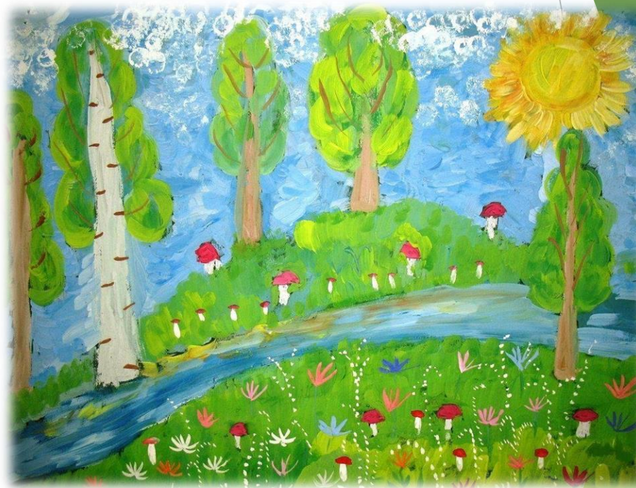
Составление природных схем