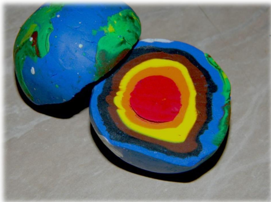
Создание макета «Слои Земли»